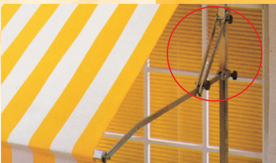
Auf Wunsch lieferbar: Die zusätzliche Windsicherung verhindert das Hochschlagen des Tuches.